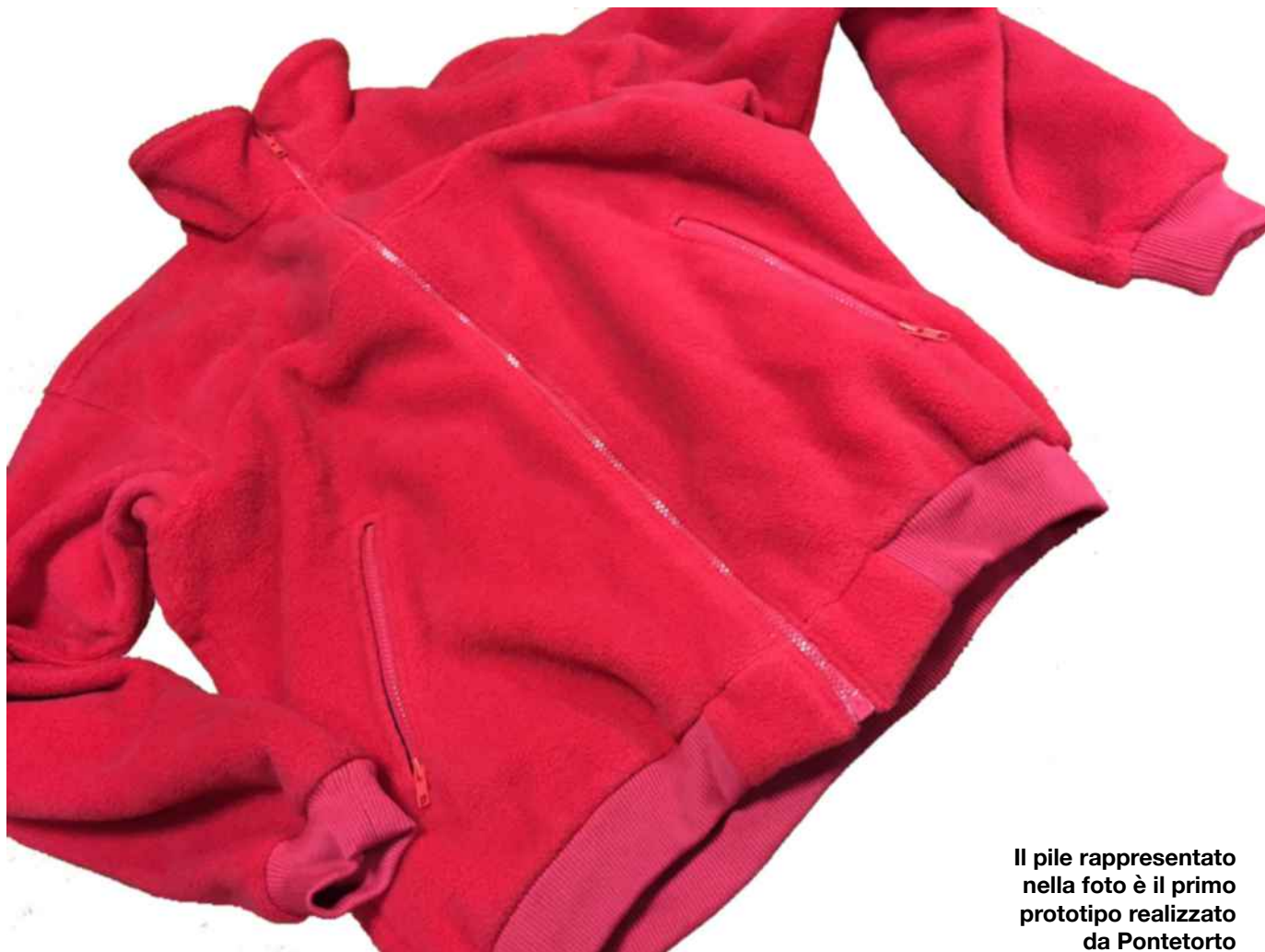
Il pile rappresentato nella foto è il primo prototipo realizzato da Pontetorto

esempio fra tutti il progetto EcoSystem, che si sviluppa ed articola in una vera e propria filosofia. La linea EcoSystem contiene tessuti creati utilizzando poliestere riciclato, filati derivati da capi d'abbigliamento riciclati e prodotti con polimeri ricavati dal riciclo delle bottiglie di plastica (pet). L'azienda ha prodotto inoltre tessuti utilizzando filati di "cotone organico", proveniente da piantagioni che garantiscono un uso cosciente della chimica secondo i criteri di basso impatto ambientale previsti per la